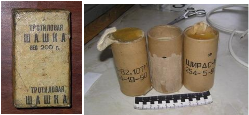
Рис.1 – внешний вид взрывчатых веществ военного инженерного назначения:

Боеприпасы — изделия военной техники одноразового применения, предназначенные для поражения живой силы, техники и сооружений противника: боевые части ракет, авиационные бомбы, артиллерийские боеприпасы (снаряды, мины, выстрелы), инженерные боеприпасы (противотанковые и противопехотные мины), ручные гранаты, стрелковые боеприпасы (патроны к пистолетам, автоматам, пулеметам).