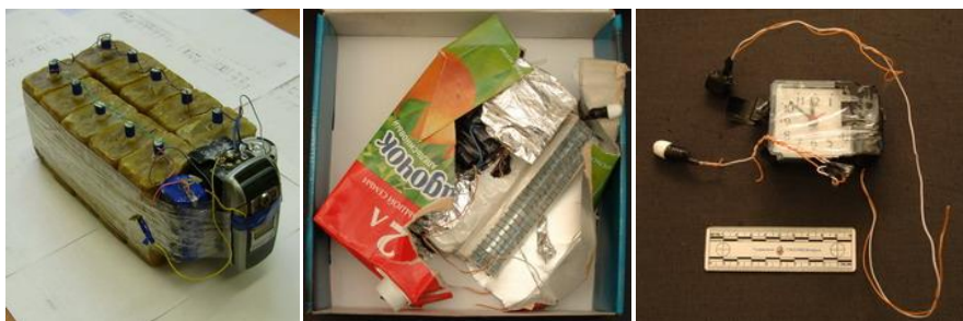
Рис.3 – внешний вид самодельных взрывных устройств

Скрытый пронос под одеждой и в ручной клади является самым распространенным способом доставки террористических средств к месту проведения террористической акции. Наиболее часто этот канал используется для доставки огнестрельного оружия. Огнестрельное оружие в собранном и разобранном виде имеет хорошо известные, достаточно специфичные и узнаваемые формы узлов, деталей и механизмов. Под одеждой и в ручной клади могут доставляться также взрывные устройства и радиоактивные вещества.